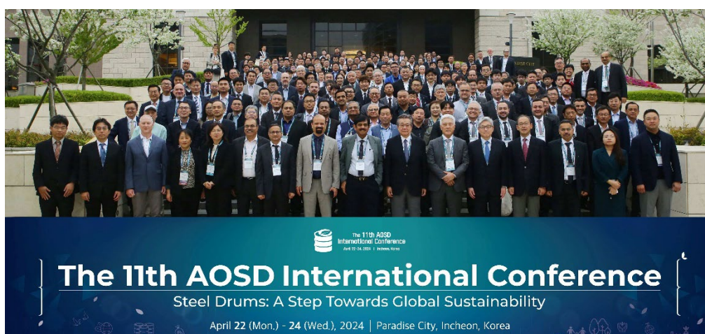
出席者全員による集合写真