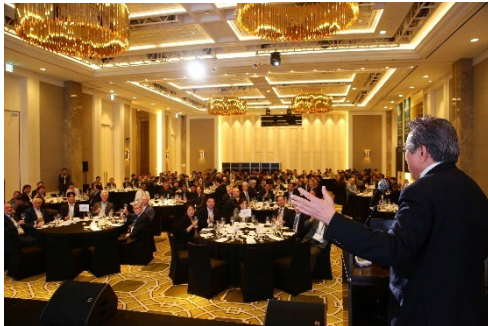
会議会場となった Paradise City Hotel