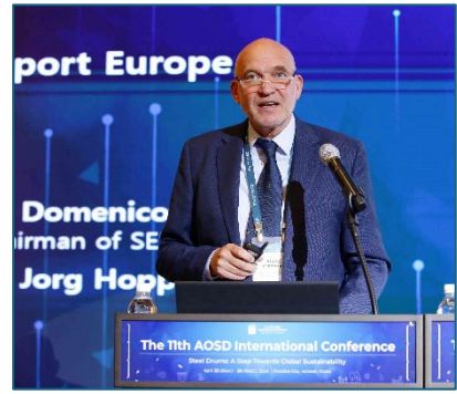
欧米からの参加者による挨拶とプレゼンテーション